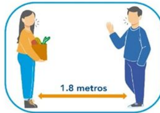
5 Distanciamiento social