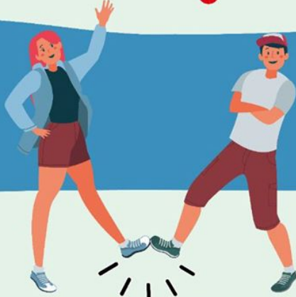
CON EL PIE