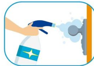
3 Limpiar las superficies de alto contacto