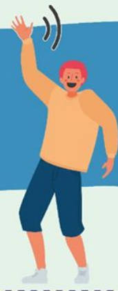
AGITANDO LAS MANOS