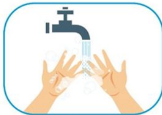
1 Lavado de manos