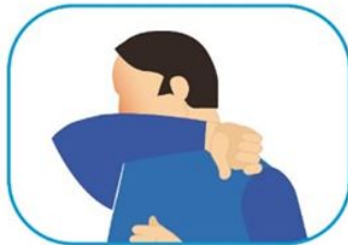
4 Protocolo de estornudo y tos