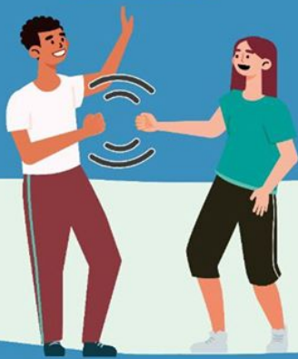
CON EL PUÑO DE LEJOS