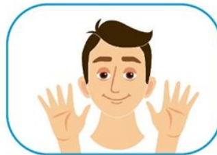
2 No se toque la cara si no se ha lavado las manos