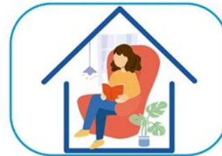
6 Quedate en casa